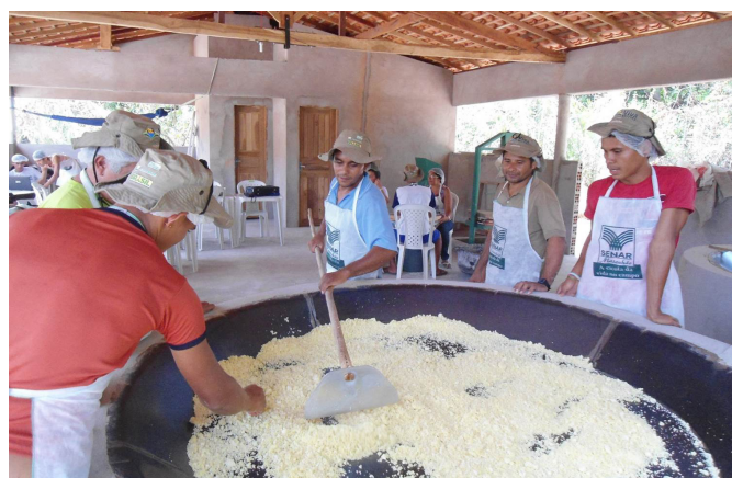
Aula prática do curso de fabricação de farinha de mandioca.