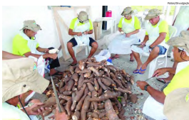
Produtores do povoado Vereda, em Barreirinhas, durante treinamento em fabricação de farinha

Mais - O projeto Viva Vereda, desenvolvido pelo Inagro, visa elevar a renda dos produtores, por meio da melhoria da produção existente nos povoados e da inserção de novas atividades agrícolas.