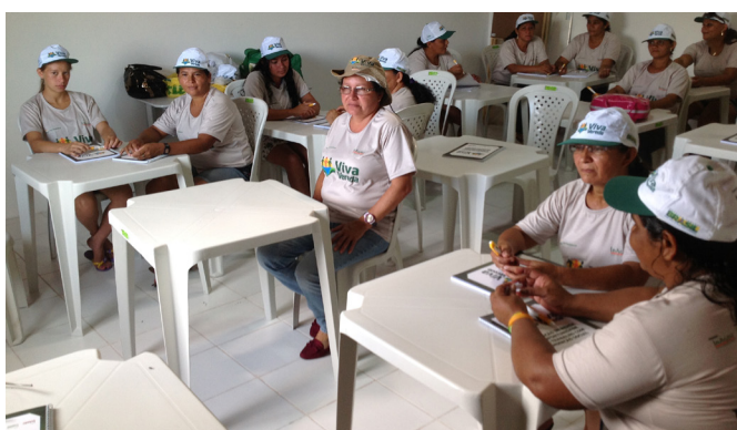
Aula teórica do curso de artesanato

qualidade da farinha de mandioca já produzida por eles, agregando mais valor ao produto. Foram trabalhados durante o treinamento princípios de higienização e padronização da farinha, cuidados, regulagens e operacionalização de máquinas e equipamentos, noções sobre o mercado e comercialização do produto e outros derivados, extração da fécula e fabricação de farinha seca fina, seca quebradinha e de farinha d'água e mista, além da classificação, embalagem e armazenamento.