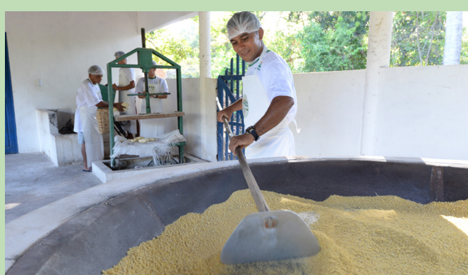
Produtores na casa de farinha de mandioca