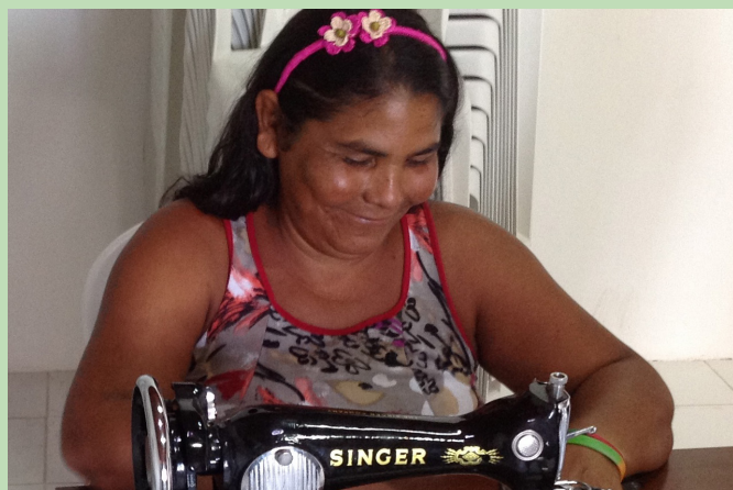
Produtora utiliza máquina de costura adquirida pelo Projeto Viva Vereda.