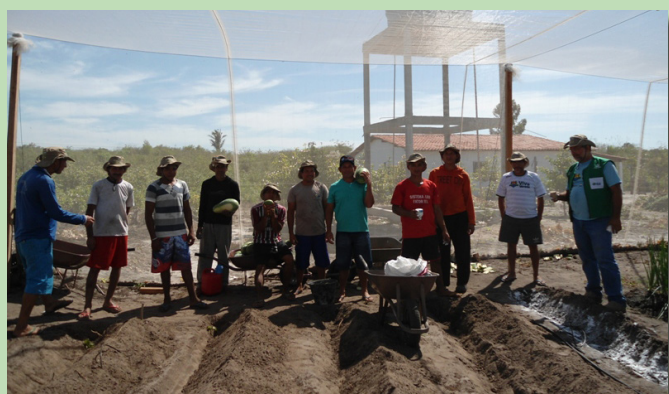
Preparo da horta para o plantio de hortaliças.