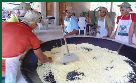
Produtores receberam treinamentos em diversas áreas