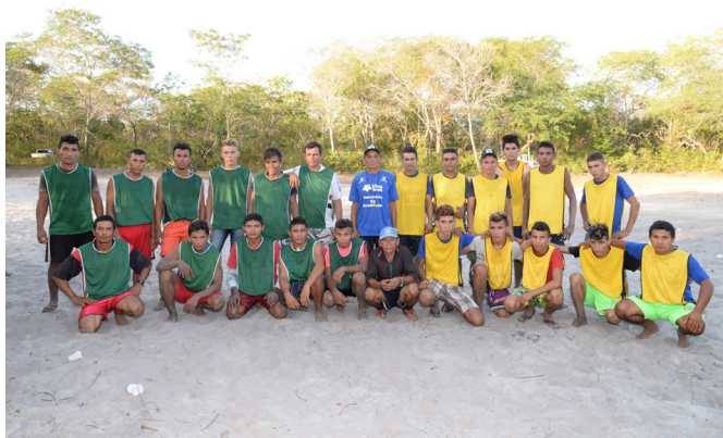
Partida de Futebol encerrou as competições entre os dois povoados