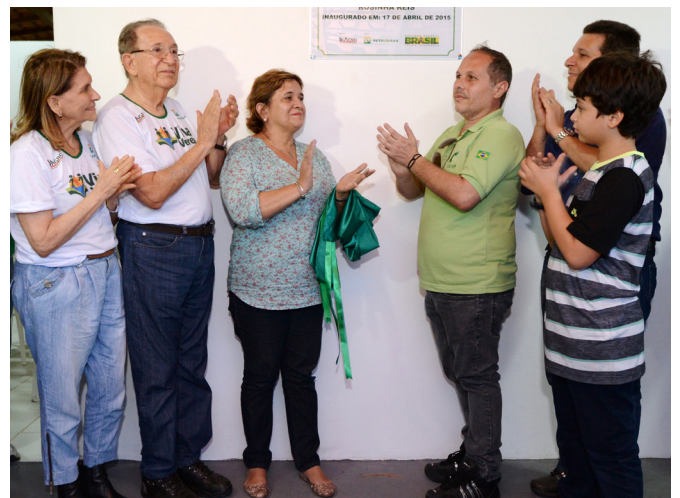
Inauguração do centro educacional Rosinha Reis