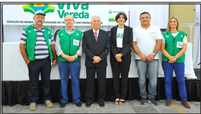
Equipe do Inagro que trabalhou no Projeto Viva Vereda