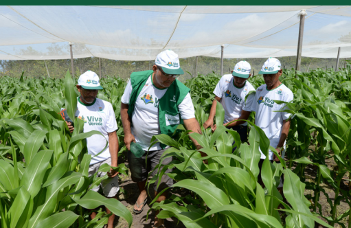
Novas tecnologias estão aumentando e diversificando a produção agrícola