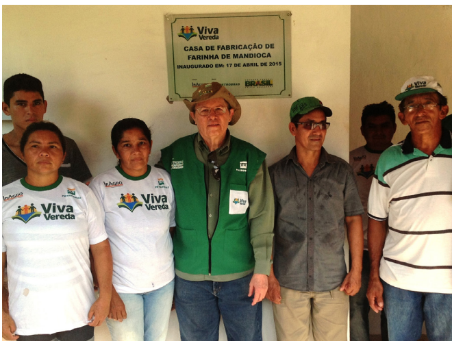
Inauguração da casa de farinha do povoado Rio Grande