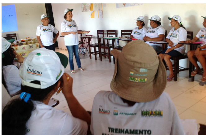
Aula teórica do curso de fabricação de polpa de frutas e doces