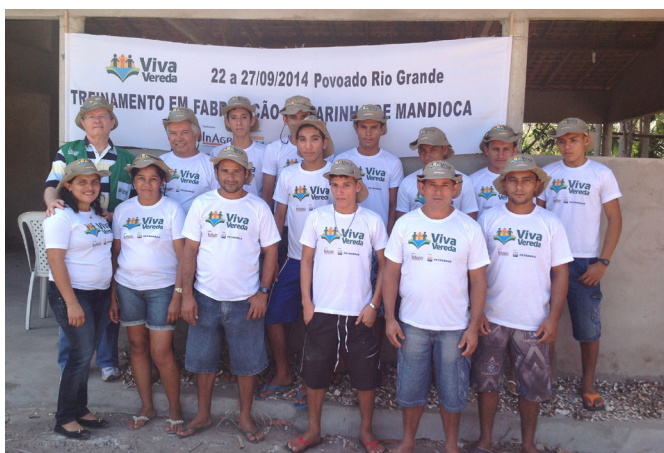
Moradores do Povoado Rio Grande durante o treinamento em fabricação de farinha de mandioca.