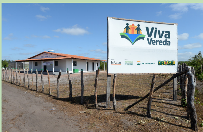
Área onde foi construído o centro educacional