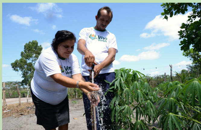
Inagro implantou rede de distribuição de água