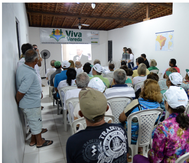
Sala do Centro Educacional lotou durante a inauguração oficial das obras do Viva Vereda.