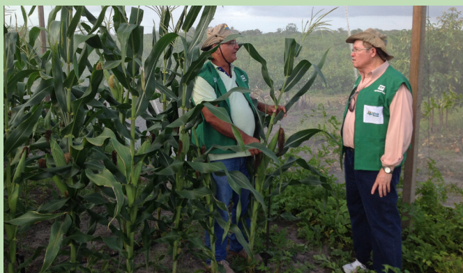
Técnico e gestor do projeto avaliam plantio de milho.