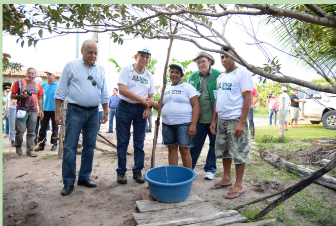
Inauguração do Sistema Simplificado de Abastecimento de Água.