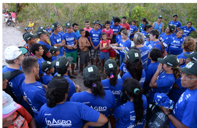
Moradores de Vereda e Rio Grande receberam brindes do Inagro