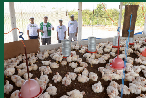
Obras e equipamentos estão dando suporte para a produção