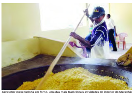
Apartir de hoje, a farinha será produzida em uma das mais tradicionais atividades do interior do Maranhão

Projeto - O projeto Viva Vereda, desenvolvido pelo Inagro, visa elevar a renda dos produtores, por meio da melhoria da produção existente nos povoados e da inserção de novas atividades agrícolas.