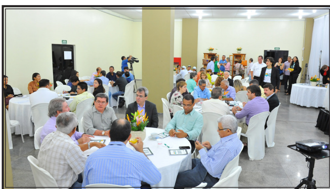
Gestores do setor público e da iniciativa privada e a imprensa de São Luís compareceram ao evento de lançamento.