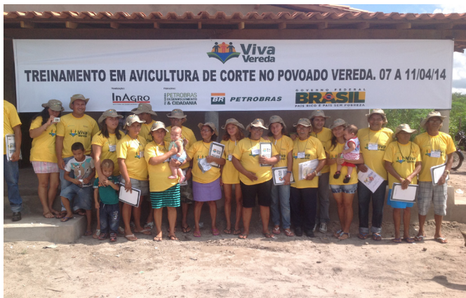
Participantes do treinamento em avicultura