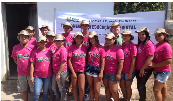
O Treinamento em Educação Ambiental foi realizado no Povoado Rio Grande.