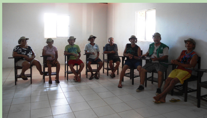
Reunião sobre a assistência técnica do projeto.