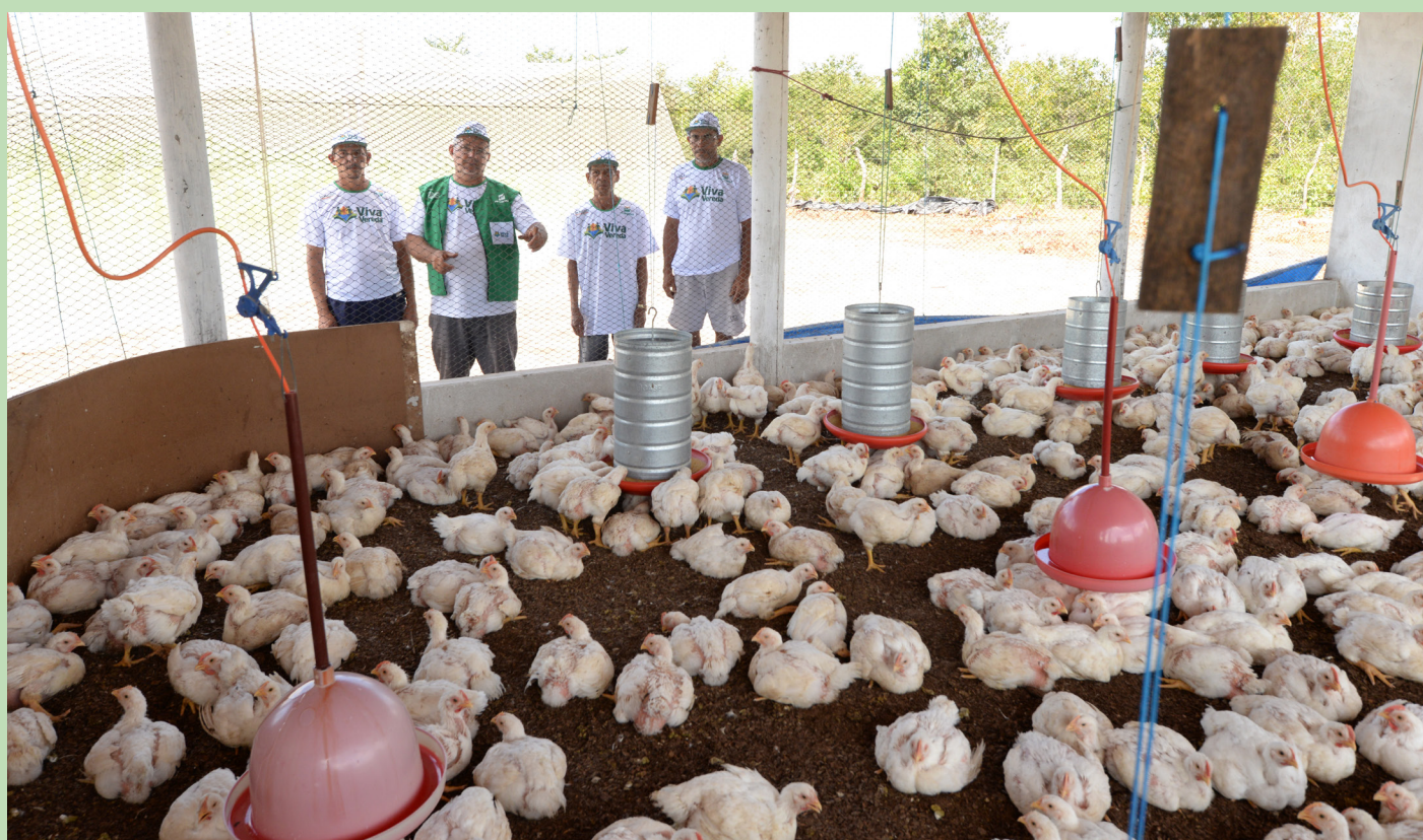
Aviário construído pelo Projeto Viva Vereda.

Todos os lotes de frangos até agora produzidos foram comercializados na comunidade e povoados vizinhos e para a Cooperativa de Produtores Hortifrutigranjeiros de Barreirinhas (COOPB), que ganhou a licitação da prefeitura municipal de Barreirinhas. As aves são fornecidas para a merenda escolar da rede municipal de ensino, de acordo com a lei nº 11.947/2009 que obriga, no mínimo, que 30% dos recursos financeiros repassados pelo Fundo de Desenvolvimento Nacional de Educação (FNDE) sejam com a aquisição de gêneros alimentícios diretamente da agricultura familiar e do empreendedor familiar para o Programa Nacional de Alimentação