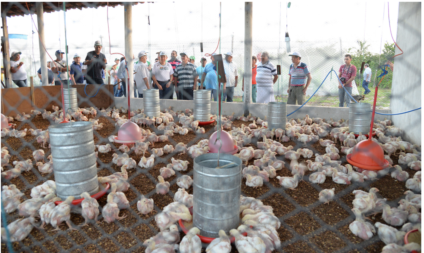
Na inauguração, gestores do Inagro e convidados para a inauguração das obras observam o aviário.