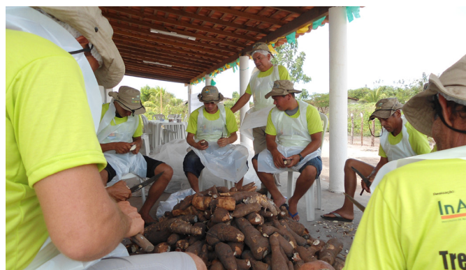
Produtores descascam mandioca durante aula prática do curso de fabricação de farinha de mandioca