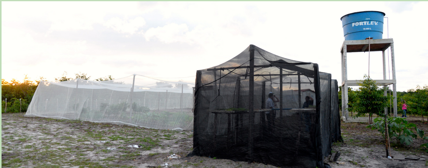
Horta, viveiro de mudas e caixa de água implantados pelo projeto no povoado Vereda.